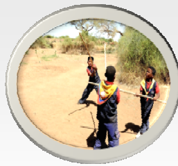
معسكر الكشافة المسابقات النهارية