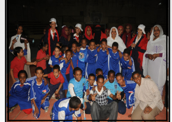
مسابقات كرة القدم فريق كرة القدم مدرسة الخرطوم